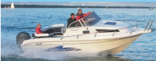
640 FS - ob - ZÁVĚSNÝ MOTOR