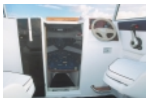
640 FS - ib - ZABUDOVANÝ MOTOR