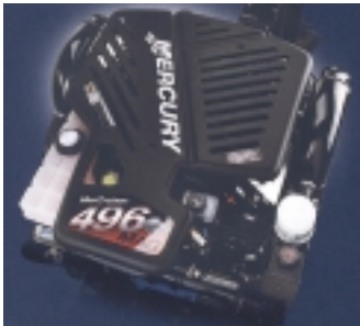
MerCruiser 496 MAG

Zabudované lodní motory MerCruiser v provedení s karburátorem je možné koupit ve čtyřválcovém provedení 3.0L (výkon 135 HP), nebo v šestiválcovém provedení 4.3L (výkon 190 HP) a konečně v osmiválcovém provedení 5.0L - výkon 220 HP nebo 5.7L - 250 HP se Z-náhonem podle Vaší volby.