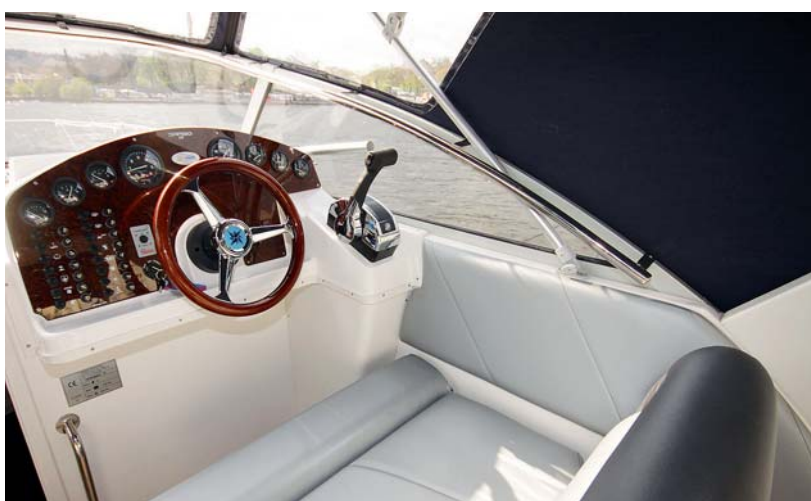
Na pravé straně kokpitu je pro řidiče k dispozici široká dvouseďačka, kam se pohodlně vejde i spolujezdec.