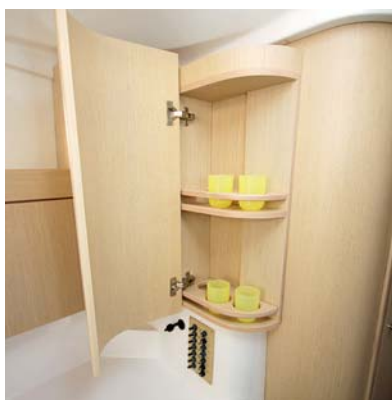
Zajímavě řešená skříňka v kuchyni