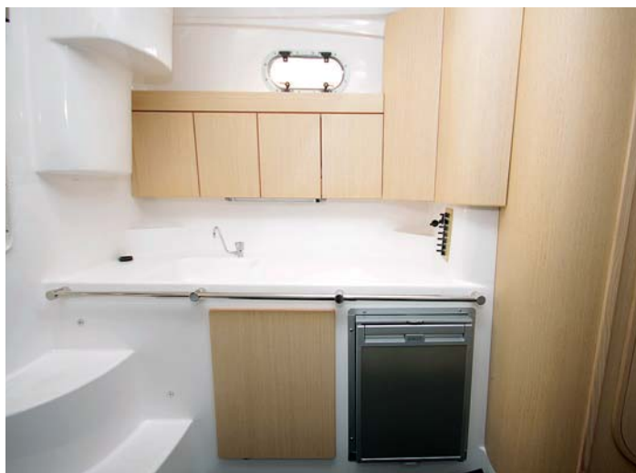
Nalevo je kuchyňský stůl s vaříčem, dřezem, chladničkou, mikrovlnnou troubou a odkládacím prostorem pro nádobí.