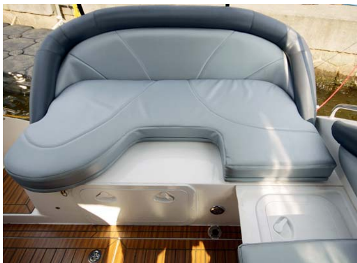
Velice komfortní je pohovka na zádi člunu, která je posuvná, čímž lze získat zvětšený prostor pro pobyt na palubě při kotvení.

Na vodě se loď chová i přes svoji značnou výšku poměrně slušně. Člun v přímé jízdě dobře drží stopu a jede rovně bez náklonu. V ostrých zatáčkách se poněkud více naklání, ale to je ten pravý adrenalinový zážitek pro řidiče a posádku. S motorem MerCruiser 350 MAG o výkonu 300 koní dobře akce-