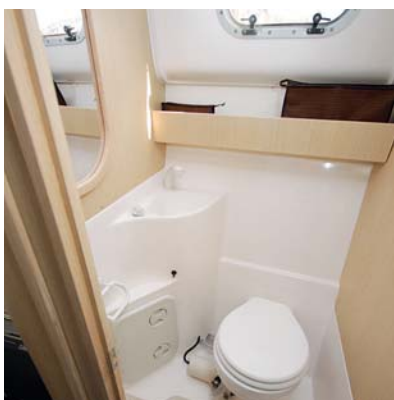
Za kuchyní po levé straně se nachází koupelna s umyvadlem, sprchou, poličkami a WC.