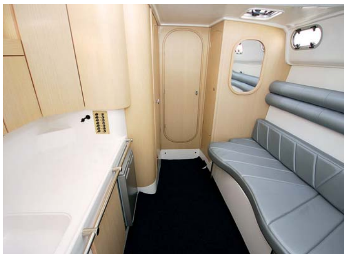
Interiéru dominuje středová kajuta se stojnou výškou 1,9 m.