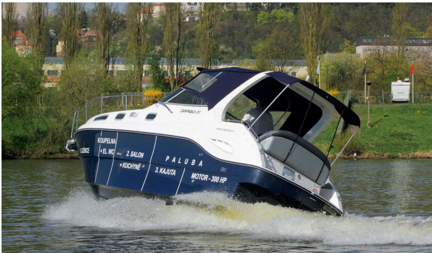
Celý kokpit je možné zakrýt persenikem.