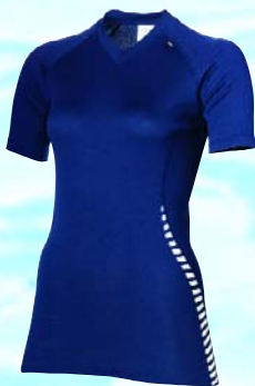
Damenshirt mit elastischem V-Ausschnitt