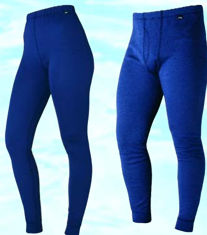
Funktionshose, marineblau mit Gummizug. Die ideale Ergänzung unter der Sportbekleidung