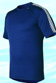
Herrenshirt mit elastischem Rundhalsschnitt