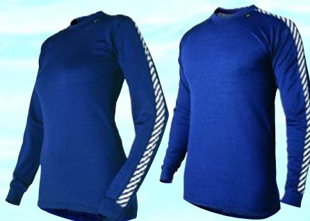
mit elastischem Rundhalsschnitt