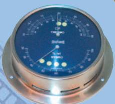
Thermometer/Hygrometer Größe 2, aus rostfreiem Stahl. 63 0694 aus poliertem Messing. 63 0688