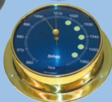
Barometer Größe 2, aus rostfreiem Stahl 63 0692 aus poliertem Messing 63 0686