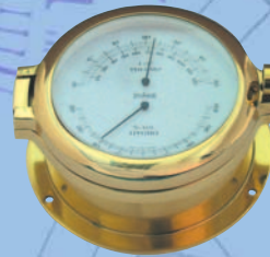
Kombination Thermo- und Hygrometer