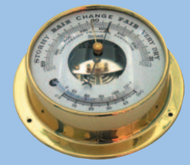
Barometer mit Sichtwerk und Flüssigkeitsthermometer