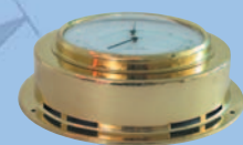
Gehäuseform Größe 3