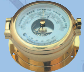
Barometer mit Sichtwerk und Flüssigkeitsthermometer