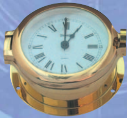
Quarzuhr mit römische Ziffern

aus gegossenem und poliertem Messing, schwere Ausführung, mit Mineralglas und Facettenschliff. Höhe 64mm, Skala 102mm, Gehäusedurchmesser 134mm.