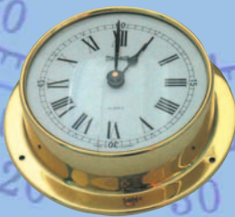
Quarzuhr mit römische Ziffern