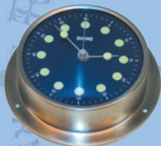
Quarzuhr Größe 2, aus rostfreiem Stahl 63 0693 poliertem Messing 63 0687