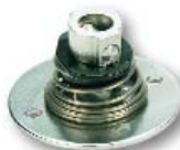
Für Größe 3 Best. Nr.: 57 6273