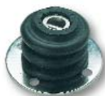
Für Größe 2 Best. Nr.: 57 6272